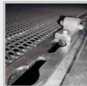
/ BEKO-Zurr-Quick® Zurrschiene

Weitere Informationen und Bilder finden Sie unter: www.beko-trucks.com/ladungssicherung