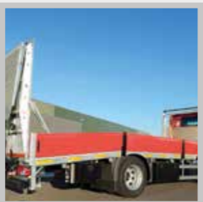
/ Alubordwand 40 cm klappbar