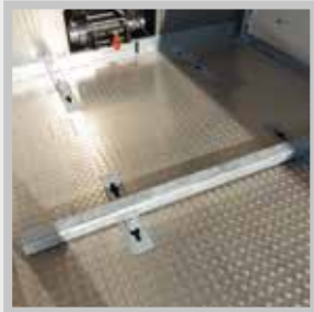
/ Anschlagballen variable