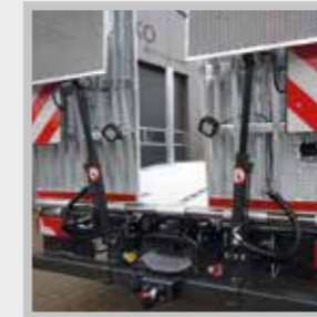
/ Kombination Anhängerkupplung Maul / Kugel, Warntafeln § 70, Rückfahrkamera