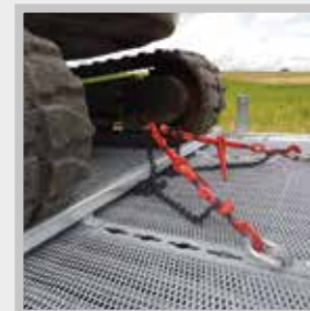
/ BEKO-Zurr-Quick® Zurrschiene mit Anschlagbalken, Zurrösen variabel