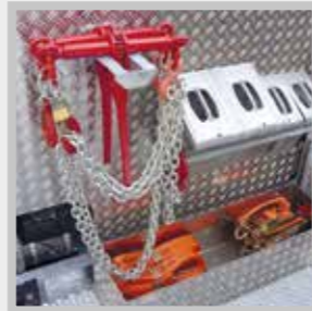
/ Ordnung System-Halter