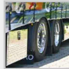
/ Zusätzliche INOX Staukästen unter dem Fahrzeug