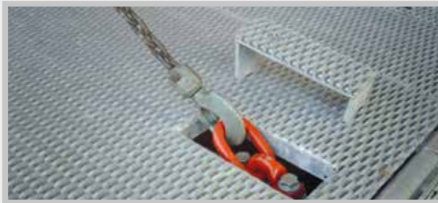
/ Schwerlastösen im Ladeboden