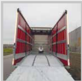
/ Plane Code XXL, Heckrungen teleskopierbar, Liftmaster Hubdach