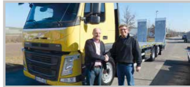
/ Zufriedene Kunden sind unser Ziel