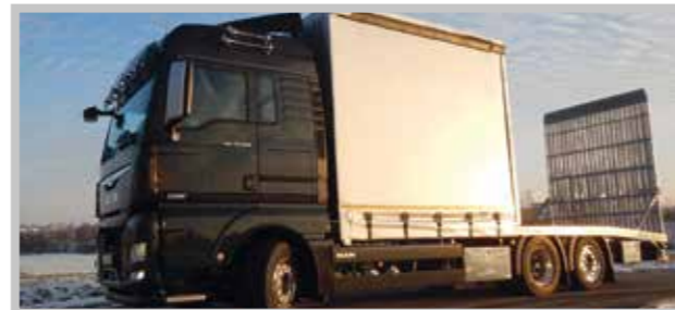
/ Halbplane mit Schiebeverdeck

„Die Qualität der BEKO Aufbauten steckt im Detail und wird ständig weiterentwickelt und optimiert. Das wissen viele treue Kunden schon seit Jahren zu schätzen.“