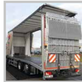
/ Liftmaster Hubdach 40 cm