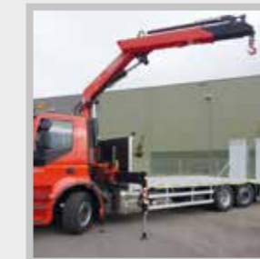
/ BEKO H mit Ladekran