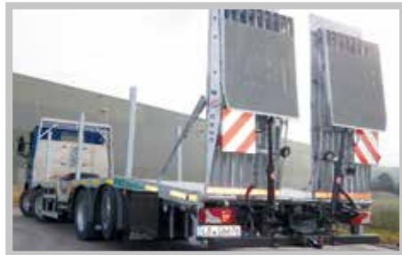
/ Tiefbett, Radmulden, Seitenrungen