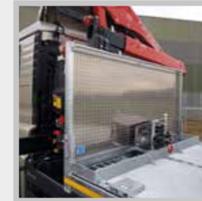
/ Seilwinde verschiebbar, Twistlock