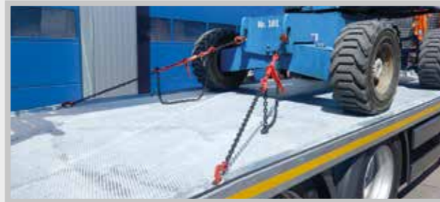
/ Zurröse Grundausrüstung, Antirutschkante