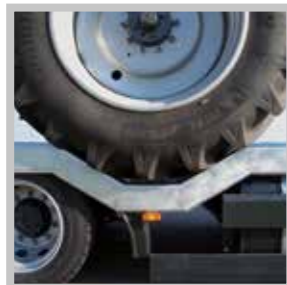
/ Radmulden ca. 65 cm Ladehöhe