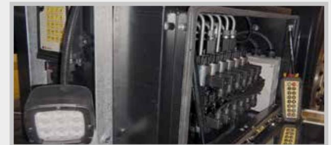
/ Funkfernsteuerung für Hydraulik

Weitere Informationen und Bilder finden Sie unter: www.beko-trucks.com/zubehoer