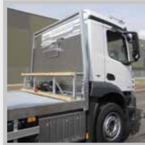
/ Anfahrbock 5 t