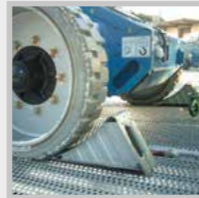
/ Anfahrkeil arretierbar im Streckgitterboden