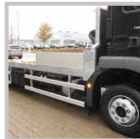
/ Alubordwand 30 cm